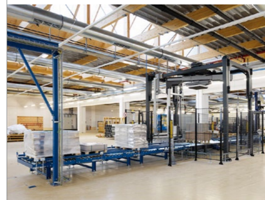
Die Förderstrecke mit automatischer Konturenkontrolle, Umreifung, Wicklung und Etikettierung bewältigt Paletten mit großen Maßunterschieden.

Gewichtsoptimierte Konstruktion der drei Regalbediengeräte (RBG), optimale Tourenbereitstellung – dieser aktuelle LTW-Eco-Standard wird um einige neue Features ergänzt. So nützt LTW die Tatsache aus, dass jede Abwärtsbewegung des Hubschlittens Energie freisetzt. Diese wird in Strom umgewandelt und ins Netz zurückgespeist.