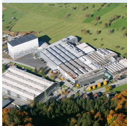
Bilanz des aktuellen Bauprojekts: 79% mehr umbauter Raum, 40% weniger fossile Energie.

Als einer der ersten Packmittelhersteller Europas hat das Unternehmen 2009 den natureOffice -Standard für klimaneutrales Drucken implementiert: Zu jedem Druckauftrag werden lückenlos die CO 2 -Emissionswerte berechnet. Der Kompensationsbetrag fällt naturgemäß umso niedriger aus, je klimafreundlicher die Produktionskette organisiert ist – von der Kartonherstellung bis zur Logistik.