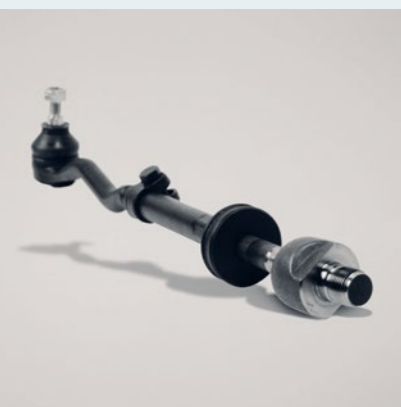
Lemförder PKW-Spurstange – eines von 10.000 Ersatzteilen, die bei ZF Services Bremen lagern.

ZF Services setzt die Systemkompetenz von ZF im After-Sales-Markt konsequent fort. Mit integrierten Lösungen sowie dem kompletten ZF-Produktportfolio sichert das Geschäftsfeld die Leistungsfähigkeit und Wirtschaftlichkeit von Fahrzeugen über deren gesamten Lebenszyklus. Antriebs- und Fahrwerktechnik von ZF werden dabei im Handelsgeschäft unter den etablierten Produktmarken Sachs, Lemförder, Boge und ZF Parts angeboten.