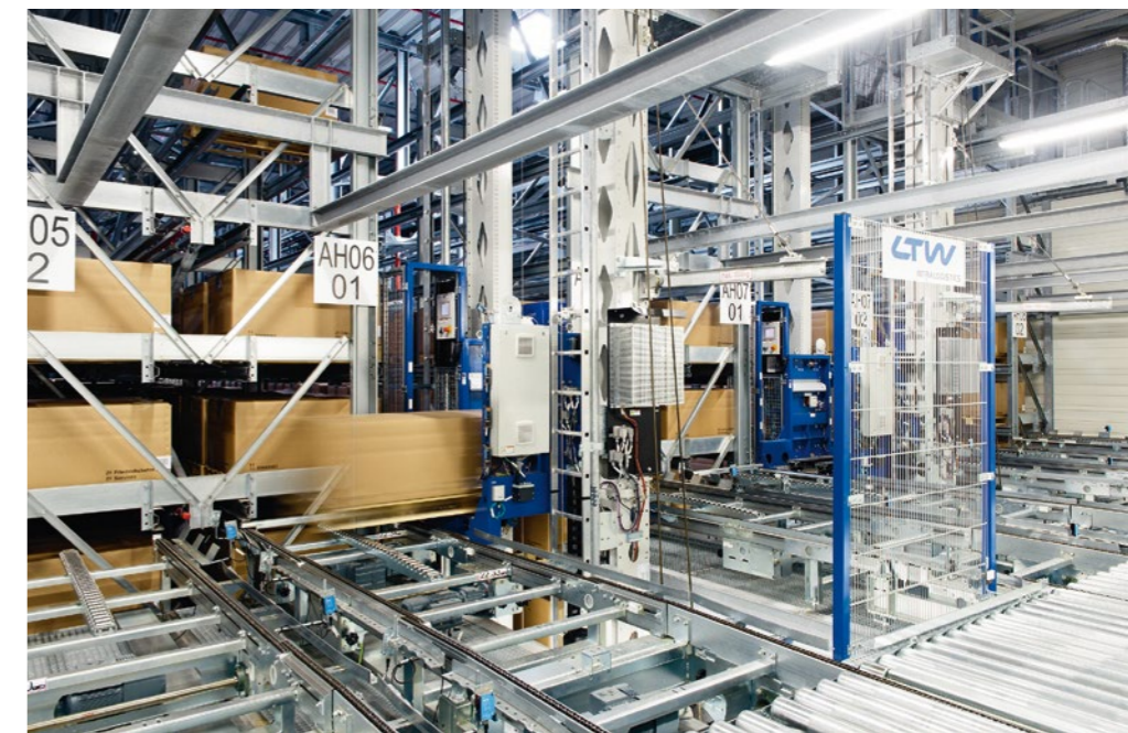
Die acht ganggebundenen LTW-Regalbediengeräte sind mit servicefreundlichen Details ausgestattet – wie einer Hebehilfe für den Austausch schwerer Komponenten oder einer Videokamera am Hubschlitten für die schnelle und zielgerichtete Störungsanalyse.