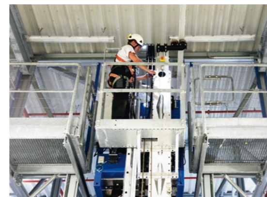
Bereits bei der Konzeption des Hochregallagers wird auf sicheres, ergonomisches Arbeiten beim Service geachtet, z.B. mit stabilen Wartungskörben am Regal.

einem Schwesterprojekt interessant, das am Hauptstandort von ZF Services in Schweinfurt seit Anfang 2010 in Betrieb ist – und bei dem sich LTW als Lieferant von sechs Regalbediengeräten (RBG) bereits bewährt hat.