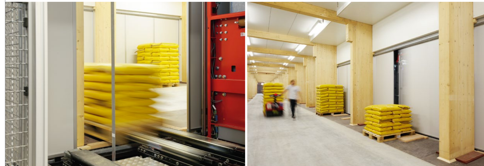
Vier Regalbediengeräte (RBG) liefern von beiden Seiten den Nachschub in die drei geräumigen, hellen Kommissioniertunnel, die sich über die gesamte Länge des Hochregallagers erstrecken. 324 Kommissioniertore von LTW sorgen für die sicherheitstechnisch geforderte Abgrenzung zwischen Tunnel und RBG-Fahrgassen.

Der Auftrag für die komplette Intralogistik geht an LTW: vier ganggebundene Regalbediengeräte (RBG), Förder-technik, Lagersteuerrechner. Den Ausschlag für LTW gibt am Ende nicht so sehr die Erfahrung mit dem Baustoff Holz, sondern das ausgewiesene Know-how als Komplettanbieter – sowie ein entscheidender Beitrag zur Kommissionierlösung.