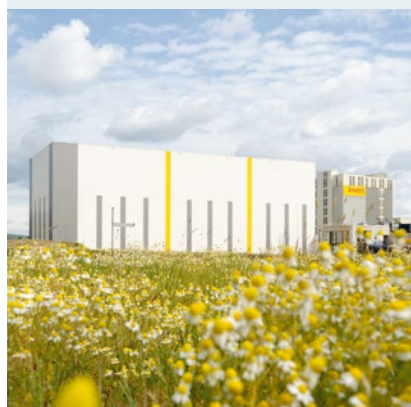
Mit 2.400 m 2 Grundfläche und 30 m Höhe eines der weltweit größten Hochregallager aus Holz.

Auch in der Produktion und Logistik setzt Josera konsequent auf Nachhaltigkeit – mit „grünem Strom“ und Bahnanschluss am Stammsitz wie auch im neuen Werk in Polen.