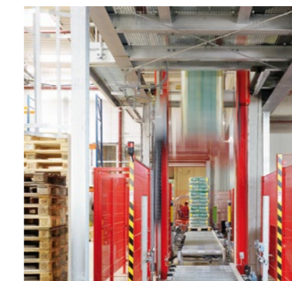
Die automatische Förderstrecke für Vollpaletten umfasst drei Vertikalförderer (Bild), zwei Verschiebewagen und Schwerkraftrollbahnen.

Wer jetzt an enge, dunkle Stollen denkt, täuscht sich allerdings: Großzügige Verkehrsflächen, helle Lichtverhältnisse, Fußbodenheizung und nicht zuletzt der