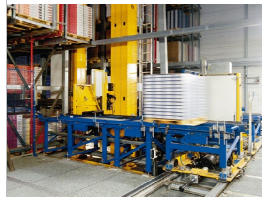
EGGER-Palettenlager mit fünf Regalbediengeräten und komplexer Fördertechnik – bewährte LTW-Qualität in der Projektphase wie im Dauerbetrieb.

Mit Blick auf maximale Sicherheit einerseits, die Kosten andererseits legt LTW die kinetischen Werte so zurückhaltend aus, wie es die geforderte Spielleistung erlaubt. Bewährte Komponenten wie die sechszinkige Teleskopgabel und die Schienenanlage werden aus dem Bestand übernommen.