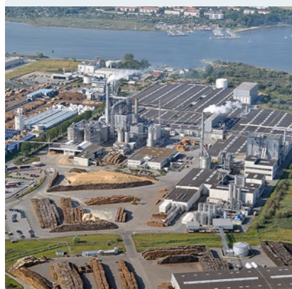
Das 900.000 m 2 große Gelände in Wismar ist per Straße, Schiene und Seeweg angebunden.

Mit 17 Werken in sechs Ländern und rund 7.100 Mitarbeitern beliefert EGGER die Möbelindustrie, den Holz-Fachhandel, Baumärkte und DIY-Geschäfte pro Jahr mit 7,4 Mio. m 3 Holzwerkstoffen und Schnittholz.